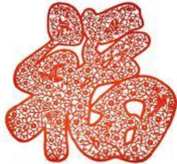
小篆“福”字，上有喜鹊八只，梅花五十八枝。 图案共六十六个，即六六大顺